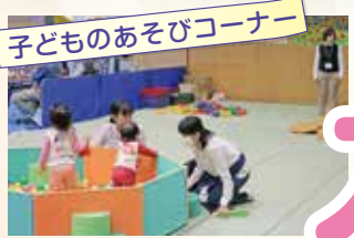
子どものあそびコーナー