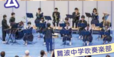
難波中学吹奏楽部

なになわ「ふくしなになわ」は、浪速区をもっともっとよくなるために、という思いの団体、個人が集って開催しています。小さなお子さまからご高齢の方、障がいをお持ちの方どなたでも一緒に楽しめるイベントです。たくさんの方のお越しをお待ちしています。車いすやバギー使用の方も安心して会場をまわれます。