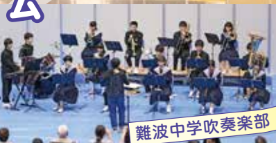
難波中学吹奏楽部