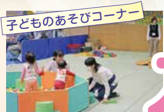
子どもあそびコーナー