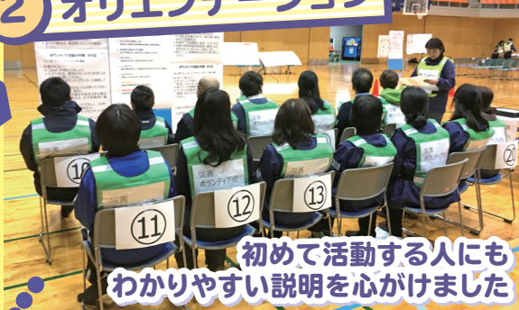
初めて活動する人にも わかりやすい説明を心がけました