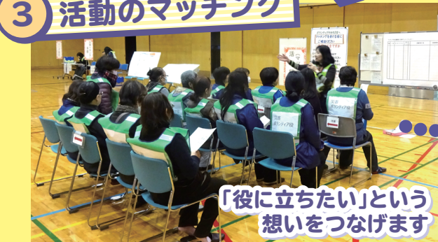
「役に立ちたい」という 想いをつなげます