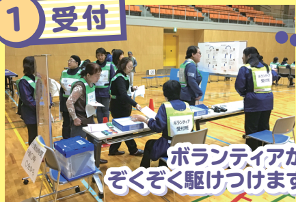
ボランティアが ぞくぞく駆けつけます