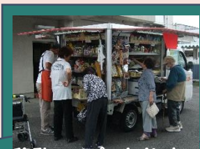
移動スーパーとくし丸