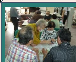
浪速区老人福祉センターでのスマホ相談会

シニアボランティアの育成を目的とした、スマホの講習会を開催。 現在、 ナニワモバイルお助け隊 として約15名が活躍中！相談会を開催しております。